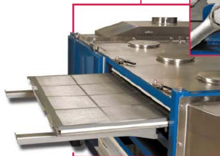
側面からのアクセスにより スクリーン交換は2分以内