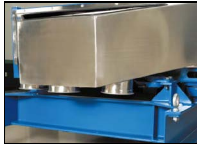
排出口へのアクセスが容易