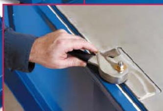
トップカバークランプ