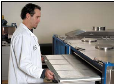
1人のオペレーターによる スクリーン交換

排出部付近では、直線往復運動へと変化します。目開きに極めて近い粒子のふるい分けをこの部分で行います。そして、オーバーサイズ粒子を排出します。