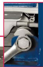
リフトカムによる シール構造