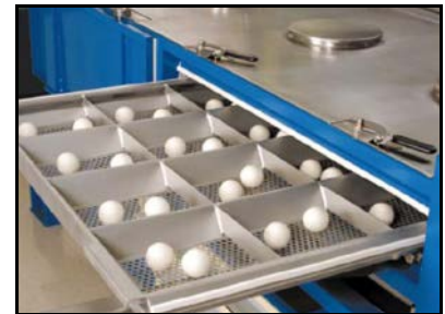
タッピングボール使用例

エイペックス™スクリーナーは、乾式によるふるい分け機です。ほぼ水平に設置されたスクリーンが振幅の大きい水平旋回運動を行います。この独特な運動により、高い分級精度と高い処理能力を発揮します。